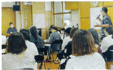
※3 法人研修中の様子