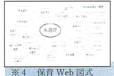
※4 保育 Web 図式